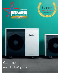
Gamme aroTHERM plus